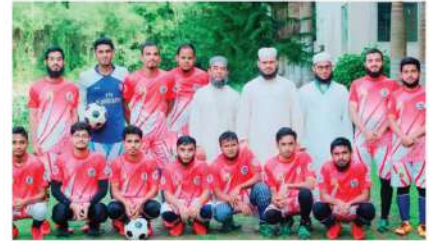
বঙ্গবন্ধু আইআইইউসি -GSD আন্তঃবিভাগীয় ফুটবল টুর্নামেন্ট ২০২২ এ অংশগ্রহনকারী আরবি বিভাগের ফুটবল টিম