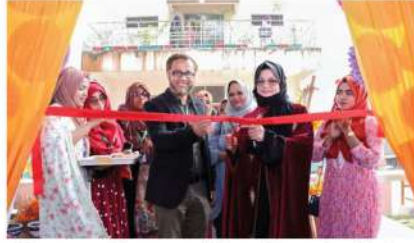
ফিমেল একাডেমিক জোন এর ইইই ক্লাব-ফিমেল চাপ্টার উইস্টার ফেস্ট