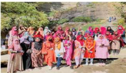
সিসিই ফিমেল সেকশনের প্রথম শিক্ষা সফর রাসামাটি