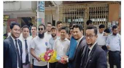
করবাজার আদালত পরিদর্শনে আই আই ইউ সি'র আইন অনুষদ