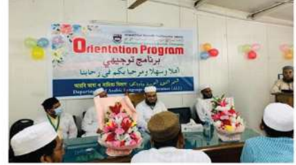
আরবি ভাষা ও সাহিত্য বিভাগের শরৎকালীন সেমিস্টার ২০২২ নবাগত ছাত্রদের বরণ