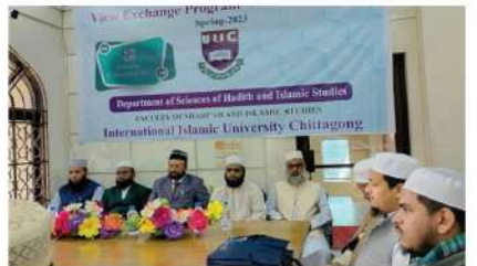
শিপ্রং-২৩ সেশনের হাদিস বিভাগের ফেশারদের নিয়ে মত বিনিময় অনুষ্ঠান