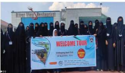
দা'ওয়াহ ওয়েলকাম ট্যুর-২০২২ (ফিমেল)