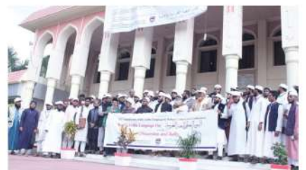
আরবি ভাষা দিবস ২০২২-এর র্যালীতে অংশগ্রহনকারী ছাত্রদের একাংশ