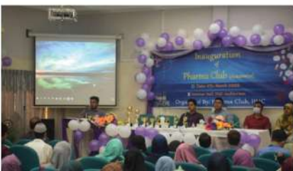
Inauguration of IIUC Pharma Club