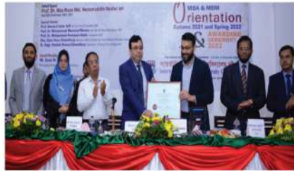
বানিজ্য অনুষদ ও ব্যবসা প্রশাসন বিভাগের উদ্যোগে উদ্যোক্তা অ্যাওয়ার্ড ২০২২ প্রদান