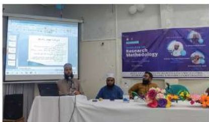
Research Methodology বিষয়ক Workshop