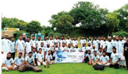
কুরআনিক সায়েন্স এন্ড ইসলামিক স্টাডিজ ডিপার্টমেন্টের মেইল সেকশনের স্টাডি টুর।