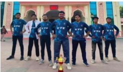
ইন্টার সেমিস্টার শর্ট পিচ ক্রিকেট টুর্নামেন্ট ২০২৩