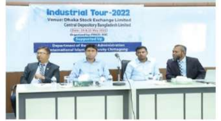
ডিএসই এবং CDBL এ আইআইউসি'র ফাইনালস ক্লাবের শিক্ষার্থীদের ইভান্সিয়াল পরিদর্শন