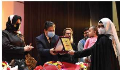
সিএসই ৪০ তম, ৪৩তম ব্যাচের বিদায় সংবর্ধনা এবং সিএসই ৫০তম ৫৩তম ব্যাচের নবীন বরণ