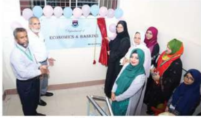
ইকোনোমিক্স এন্ড ব্যাংকিং বিভাগে ফিমেল ১৩ তম ব্যাচ কর্তৃক আয়োজিত "Graduation Ending Ceremony"