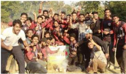
ইইই ক্লাবের উদ্যোগে ইন্টার সেমিস্টার শর্ট পিচ টুর্নামেন্ট ২০২৩