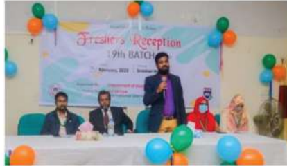
IIUC, EB Club এর উদ্যোগে ১৯তম ব্যাচের (ফিমেল) নবীন বরণ অনুষ্ঠান