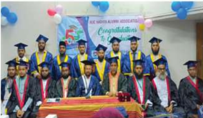
হাদিস বিভাগ তার ১ম সমাবর্তনে (বিশ্ববিদ্যালয়ের ৫ম সমাবর্তন)