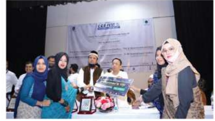
সিসিই ফেস্ট ২০২২