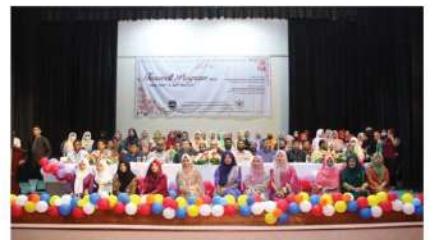
IIUC Business Club Female Chapter বিবিএর ৪৭ তম ব্যাচ এর বিদায় অনুষ্ঠান