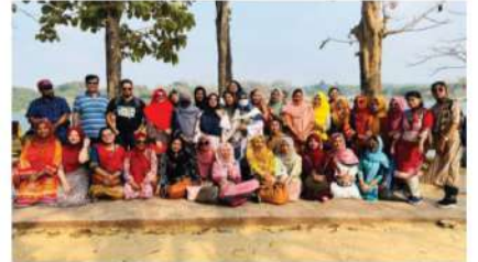
'ল' ক্লাব ফিমেল চ্যাপ্টারের উদ্যোগ কাছাই শিক্ষা সফর