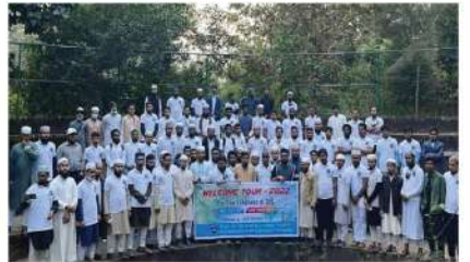
দা'ওয়াহ ওয়েলকাম টুর-২০২২