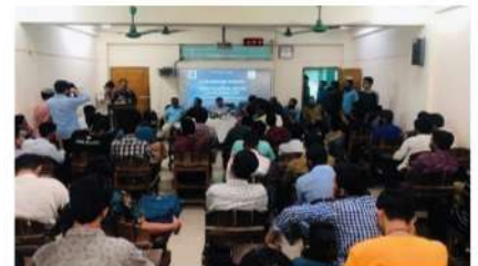
"ক্লাব হ্যাড ওভার অনুষ্ঠান এবং সেমিস্টার সাধারণ সভা "