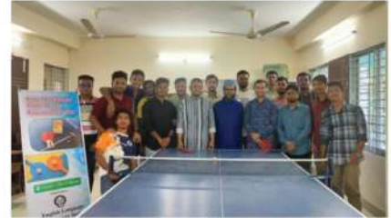
ইএলএল ইনডোর গেমস