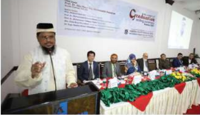
আইআইইউসি'র এমবিএ ও এমবিএম ৬৪-৬৫ তম ব্যাচের শিক্ষার্থীদের গ্রাজুয়েশন এন্ডিং সিরিমনি সম্পন্ন