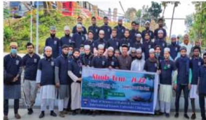
হাদীস এন্ড ইসলামিক স্টাডিজ বিভাগের কাণ্ডাই শিক্ষা সফর