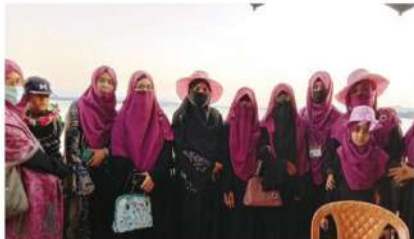
কুরানিক সাইন্সেস এন্ড ইসলামিক স্টাডিজ ডিপার্টমেন্টের ফেমেইল সেকশান এর শিক্ষা সফর