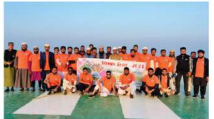
সায়েন্সে অব হাদিস অ্যান্ড ইসলামিক স্টাডিজ বিভাগের স্টাডি টুর