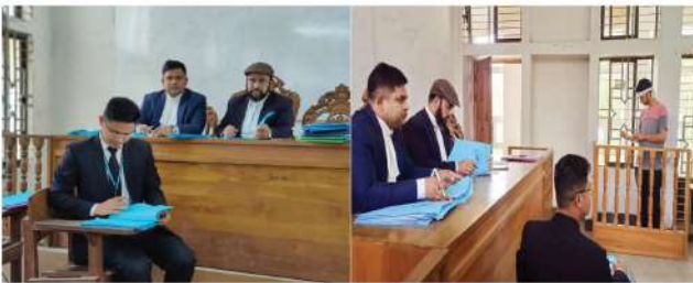
২ মার্চ ২০২২ বুধবার আইন বিভাগের ক্লাস রুমে Autumn ২০২২ শিক্ষার্থীদের বিশেষ ক্লাসে মুট কোর্ট এবং মক ট্রায়াল অনুষ্ঠিত হয়।