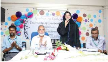
ইকোনোমিক্স এন্ড ব্যাংকিং বিভাগের ফিমেল ১৩ তম ব্যাচের "Graduation Ending Ceremony "