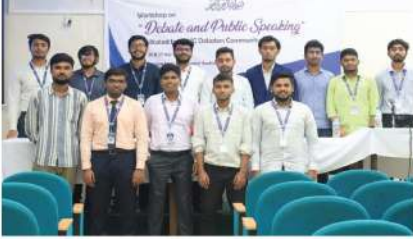
বিজনেস ক্লাব কর্তৃক আয়োজিত বিতর্ক কর্মশালা এবং প্রতিযোগিতা