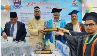
কুরআনিক সায়েন্সে অ্যালামনাই এসোসিয়েশন এর উদ্যোগে আয়োজিত পুরস্কার বিতরণী অনুষ্ঠান