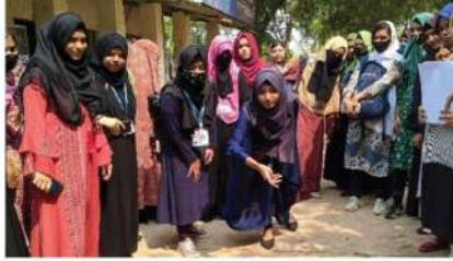
IIUC ইবিজাব (ফিমেল চ্যাপ্টার) ইভোর গেমস প্রতিযোগিতা