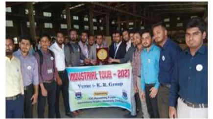
কে আর স্টিল স্ট্রাকচার লিমিটেড এ আইআইউসি'র ব্যবসা প্রশাসন বিভাগের শিক্ষার্থীদের ইভান্সিয়াল পরিদর্শন