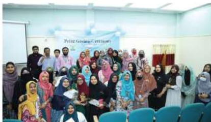
বিজনেস ক্লাব ফিমেল চ্যাপ্টারের পুরস্কার বিতরণী অনুষ্ঠান