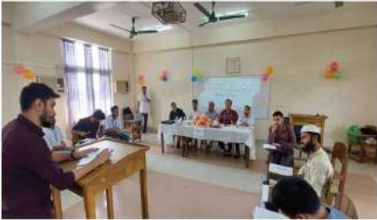
বিজনেস ক্লাব ব্যবসায় প্রশাসন বিভাগে উদ্যোগে আন্তঃসেমিস্টার বিতর্ক প্রতিযোগিতা