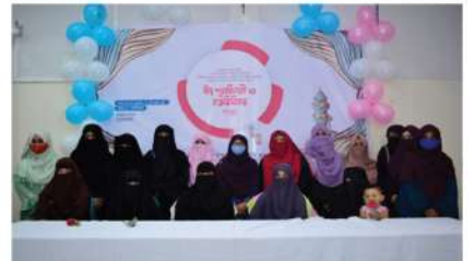
সায়েন্সেস অব হাদিস অ্যান্ড ইসলামিক স্টাডিজ বিভাগের উদ্যোগে ঈদ পূর্ণিমিলনী ও মত বিনিময় সভা