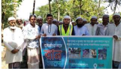
সিলেট বন্যকবলিত অসহায় শোকদের মাঝে কুরআনিক ক্লাবের ত্রাণ বিতরণ কার্যক্রম