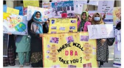
সচেতনতা মূলক র্যালি আয়োজন