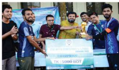
আইআইইউসি সিএসই ইন্টার সেমিস্টার ফুটবল ক্যাম্পেইন-২০২২