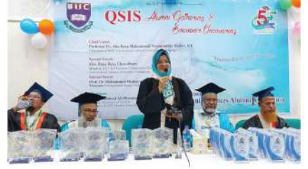
৫ম সমাবর্তন ২০২২ উপলক্ষে কুরআনিক সায়েন্সে অ্যালামনাই এসোসিয়েশন এর উদ্যোগে আয়োজিত পুরস্কার বিতরণী অনুষ্ঠান