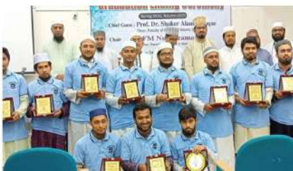
দা'ওয়াহ অ্যান্ড ইসলামিক স্টাডিজ বিভাগের উদ্যোগে মাস্টার্স প্রোগ্রামের শিপ্রং-২০/অটাম-২০ সেমিস্টারের সমাপনী অনুষ্ঠান