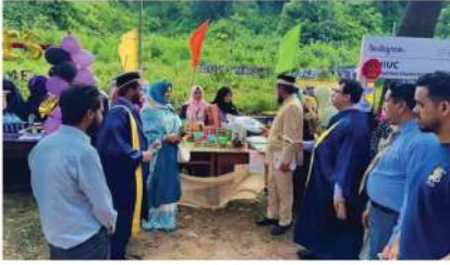
IIUC এর ৫ম সমাবর্তনে ফিমেল জোনে অতিথিবৃন্দ