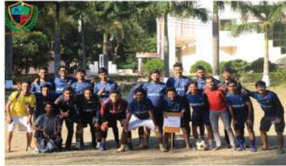
ইস্টার সেমিস্টার ফুটবল প্রতিযোগিতা