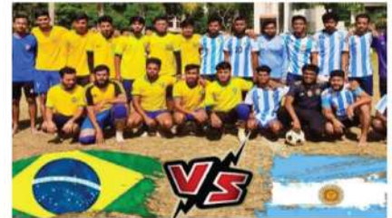
ব্রাজিল ও আর্জেন্টিনার সমর্থকদের মধ্যে প্রীতি ম্যাচ