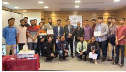
IIUC EB CLUB এর উদ্যোগে BYLC Career ১২ সনদ বিতরণ অনুষ্ঠান