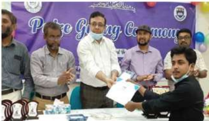
IUC, EB CLUB এর উদ্যোগে ক্রিকেট টুর্নামেন্ট ২০২২ ও পুরস্কার বিতরণ