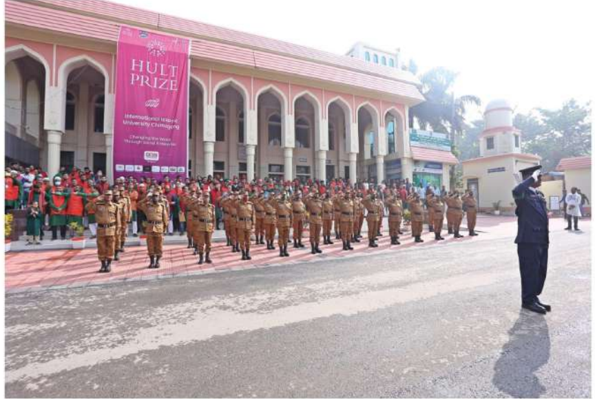
মহান বিজয় দিবস উদযাপন ২০২২ ঃ জাতীয় পতাকার প্রতি সম্মান প্রদর্শন