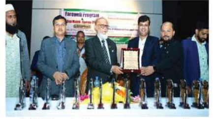
আইআইউসি'র আইন বিভাগের ৩২তম ব্যাচের ছাত্রদের বিদায় অনুষ্ঠান ও দোয়া মাহফিল