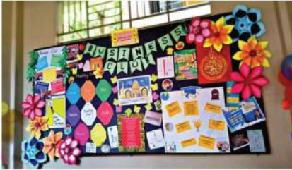
IIUC Business Club Female Chapter ওয়াল ম্যাগাজিনের উদ্বোধনী অনুষ্ঠান