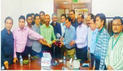
আইআইউসি'র ব্যবসায় প্রশাসন ও এইচ আর ক্লাবের যৌথ উদ্যোগে আজিম গ্রুপে ইভান্সিয়াল টুর সম্পন্ন