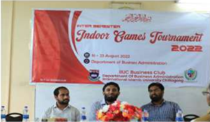
ডিজিএতে ইনডোর গেমস প্রতিযোগিতা- ২০২২