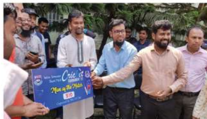
IUC, EB Club এর উদ্যোগে আন্তঃসেমিস্টার ক্রিকেট টুর্নামেন্ট ২০২২ ম্যান অব দ্যা ম্যাচ ও চেম্পিয়নশিপ পুরস্কার বিতরণ