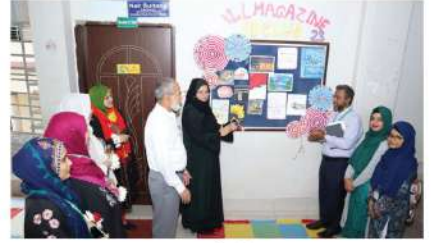
ওয়াল ম্যাগাজিন উন্মোচন