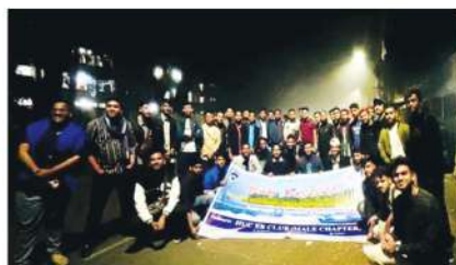
IUC, EB Club মেইল সেকশনের উদ্যোগে স্টাডি টুর