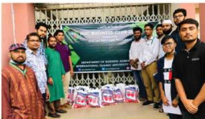
ব্যবসায় অনুষদ ক্লাবের উদ্যোগে ইফতার সামগ্রী বিতরণ