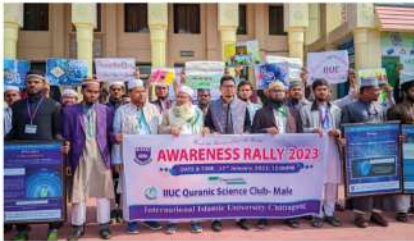
Awareness Rally সচেতনতা র্যালীতে কুরআনিক সাইন্স ক্লাব কর্তৃক স্বতঃস্ফূর্ত অংশগ্রহণ