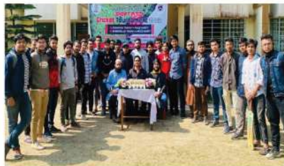
ইন্টার সেমিস্টার ক্রিকেট টুর্নামেন্ট ২০২২