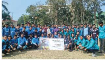
সিভিল ইঞ্জিনিয়ারিং ক্লাবের শর্ট-পিচ ক্রিকেট টুর্নামেন্ট