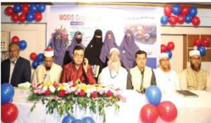
মাস্টার্স প্রোগ্রামের অরিয়েন্টেশন-ফিম্যাল সেকশন