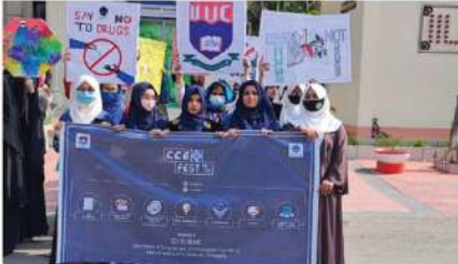
"IIUC Awareness Rally -2023"