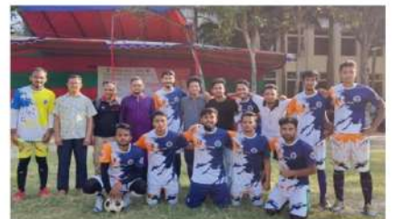
এএলএল বিভাগের ফুটবল টুর্নামেন্টে অংশগ্রহণ