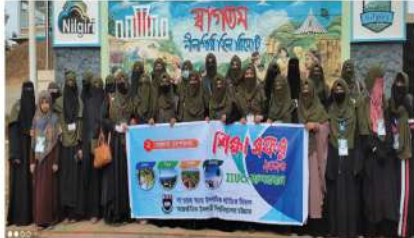
আইআইইউসি দা' ওয়াহ বিভাগের বাম্পরবান ট্যার- ২০২৩