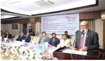
এম এস এস অটম ও শিশু ২০২২ইং সেমিস্টারের নবাগত ও সাবেক ছাত্রদের বরণ ও বিদায় অনুষ্ঠান