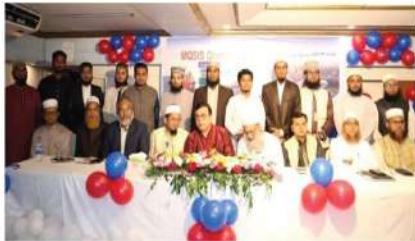
মাস্টার্স প্রোগ্রামের অরিয়েন্টেশন- মেল সেকশন