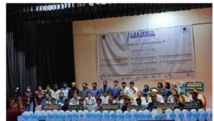
সিসিই ফেস্ট ২০২২ পুরস্কার বিতরণী অনুষ্ঠান