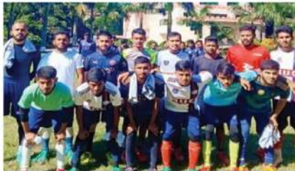
কুরআনিক সায়েন্স ফুটবল টিম-২০২২