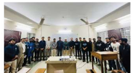
সিভিল ইঞ্জিনিয়ারিং ক্লাব ২০২৩ এর শুভ উদ্বোধন।