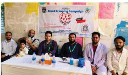
বিজনেজ ক্লাবের উদ্যোগে ব্লাড গ্রুপিং