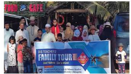
দা'ওয়াহ শিক্ষকবৃন্দের শিক্ষা সফর