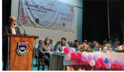
আইআইউসি ব্যবসায় প্রশাসন (বিবিএ) বিভাগের ৪৫ এবং ৪৬ তম ব্যাচের শিক্ষার্থীদের বিদায় অনুষ্ঠান