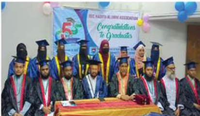
হাদিস বিভাগ তার ১ম সমাবর্তনে (বিশ্ববিদ্যালয়ের ৫ম সমাবর্তন)