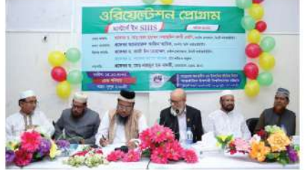
মাস্টার্সের ১ম ব্যাচের বর্ণাঢ্য ওরিয়েন্টেশন প্রোগ্রাম