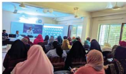
সিসিই আইওটি ওয়ার্কশপ