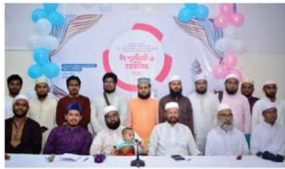
সায়োসেস অব হাদিস অ্যান্ড ইসলামিক স্টাডিজ বিভাগের ঈদ পূর্ণিমিলনী